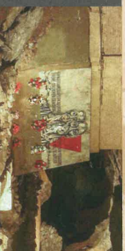
Ein Denkmal im „Kleinen Dom“ erinnert an die Opfer der Gewaltherrschaft.

Unter härtesten Bedingungen mussten 1.500 Häftlinge eine unterirdische Rüstungsfabrik mit Werkhallen, einer Feldbahn und Fahrstraßen für Autos errichten. Dabei wurden Höhlenseen zugeschüttet und mit Eisenbetondecken versehen; insgesamt 8000 m 2 betonierete Fläche entstand. In den Werkhallen wurden Fahrgestellteile für das Kriegsflugzeug JU 88 produziert. Mit der Annäherung der Front der Alliierten wurde das Lager am 4. April 1945 aufgelöst und die Häftlinge auf Todesmärsche geschickt. Im Jahr 1946 wurden die Zugänge zur Höhle gesperrt.